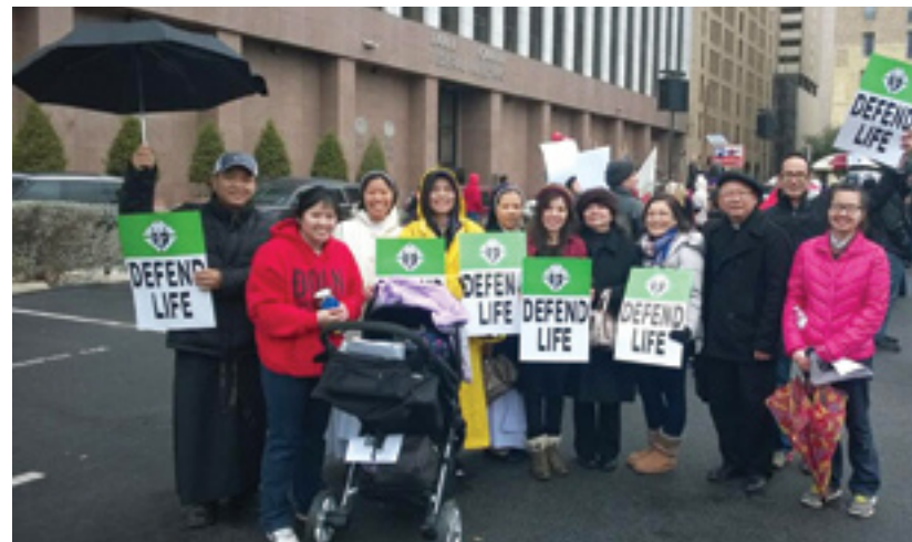
Giáo xứ ĐMHCG tham dự cuộc tuần hành phò sự sống tại Earle Cabell Federal Building, Dallas.