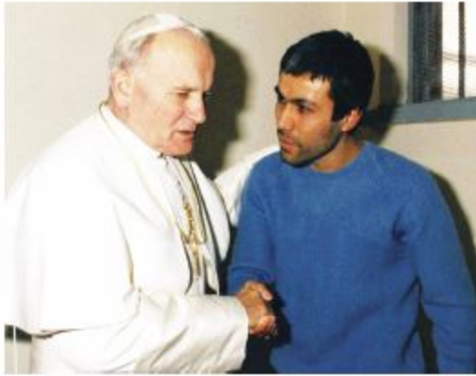
Thánh Giáo hoàng Gioan Phaolô II đã đến thăm Mehmet Ali Agca trong nhà tù

Nói một cách khác, Chúa Giêsu muốn người Kitô hữu phải sống với cách xử thế khác thường, đi ngược với lối hành xử "ăn miếng trả miếng" của con người. Theo các nhà tâm lý, một khi để sự giận dữ đối với người khác kiểm soát chúng ta, chúng ta