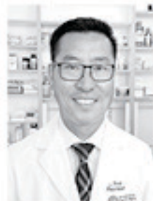
Được Sĩ Phạm Huy Hòa Kính Mời