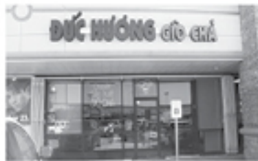
Đức Hương Houston

Đức Hương đã từng được ưa chuộng tại Cali và Houston