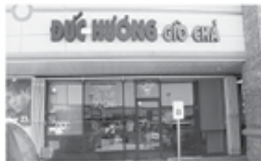
Đức Hương Houston

Đức Hương đã từng được ưa chuộng tại Cali và Houston