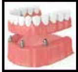
Implant- Supported Denture