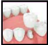
Single Tooth Dental Implant

Có trên 15 năm kinh nghiệm Fellow International Congress Oral Implantologists