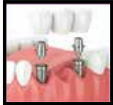
Implant- Supported Bridge

AETNA DUAL COMPLETE: HMO D-SNP AETNA HMO & PPO UNITED HEALTHCARE DUAL COMPLETE HMO-POS D-SNP, HMO-POS & PPO HUMANA MEDICARE