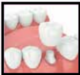
Single Tooth Dental Implant

Có trên 15 năm kinh nghiệm Fellow International Congress Oral Implantologists