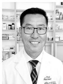
Được Sĩ Phạm Huy Hòa Kính Mời