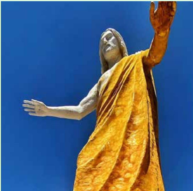
Bức tượng ở Zacatecas