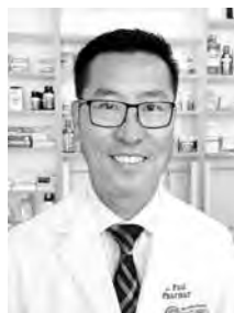
Được Sĩ Phạm Huy Hòa Kính Mời