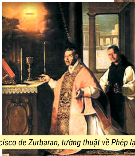
Francisco de Zurbarán, tường thuật về Phép lạ