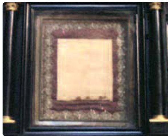
Thánh tích tấm khăn thánh thấm Máu