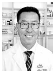
Được Sĩ Phạm Huy Hòa Kính Mời