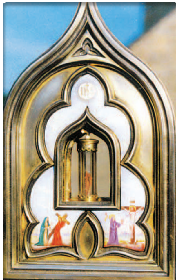
Mặt nhật gìn giữ Thánh Tích đựng Thánh Thể nhiệm màu

◀ Đọc thêm chi tiết về Phép lạ ở Blanot theo đường link này miracolieuucaristici.org