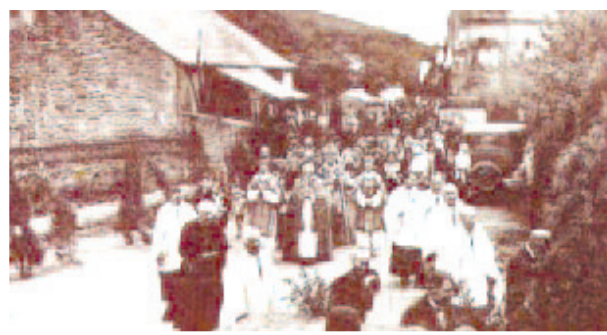
Cuộc kiệu rước kỷ niệm Phép lạ