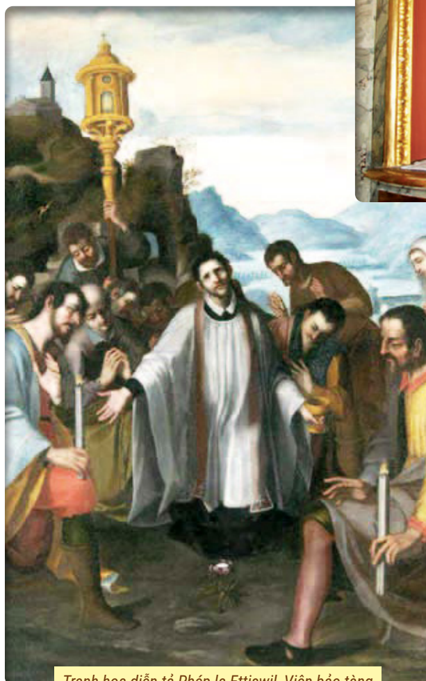
Tranh họa diễn tả Phép lạ Ettiswil, Viện bảo tàng Hiéron, Paray-le-Monial