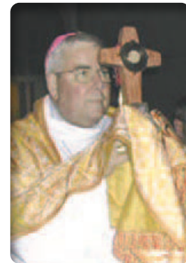
Năm 1975, Cha sở nhà thờ thánh Phêrô đang nâng cao Thánh Thể của năm 1254