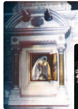
Nhà tạm nơi lưu giữ Thánh Thể phép lạ

vào ngày thứ tư Phục Sinh mỗi năm, có hồ sơ ghi chép rõ ràng. Các thánh tích được gìn giữ và tôn thờ, cho đến ngày Cách mạng Pháp bùng nổ mới bị thất lạc không tìm ra dấu vết trong một khoảng thời gian dài. Nhưng đến năm 1854, cha sở nhà thờ thánh Phêrô ở Douai may mắn tìm ra một cái hộp gỗ dấu kín dưới tượng Chúa Kitô nơi Bàn thờ của những Người Chết. Thánh Thể nằm trong hộp ấy vẫn còn màu trắng và bị sứt mẻ nơi viền mép. Ngoài ra còn có một mảnh giấy nhỏ viết bằng tiếng La tinh đề ngày 5 tháng giêng, năm 1793 (trước Cách mạng Pháp): “Tôi là Cha sở của nhà thờ thần học viện nổi tiếng thánh Amato, chứng nhận đây chính là Thánh Thể Thực Sự. Tôi đã kịp dời đi chỗ khác để Thánh Thể không bị xúc phạm. Tôi để Thánh Thể vào hộp pyx này và chứng nhận bằng chính chữ viết tay của tôi, để dành cho những ai sẽ tìm được Phép Lạ Cực Thánh này trong tương lai.” ✠