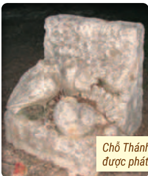
Chỗ Thánh Thể được phát giác

Thánh thể được cung nghinh trở lại bằng kiệu trọng thể. Phần Juan bị hối hận nên quyết định xưng tội. Một nhà nguyện được cất lên ngay nơi tìm được Thánh Thể. Năm 1570 cha xứ đặt kế hoạch tu trang nới rộng nhà thờ, và từ đó mỗi năm có cuộc rước kiệu long trọng vào ngày thứ 8 của lễ Mình Máu Chúa, để kỷ niệm Phép lạ. ✠