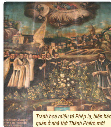
Tranh họa miêu tả Phép lạ, hiện bảo quản ở nhà thờ Thánh Phêrô mới

◀ Đọc thêm chi tiết về Phép lạ Ponferrada theo đường link này miracolieuucaristici.org