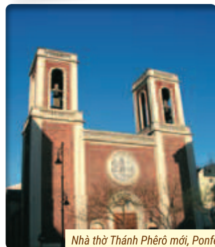
Nhà thờ Thánh Phêrô mới, Ponferrada