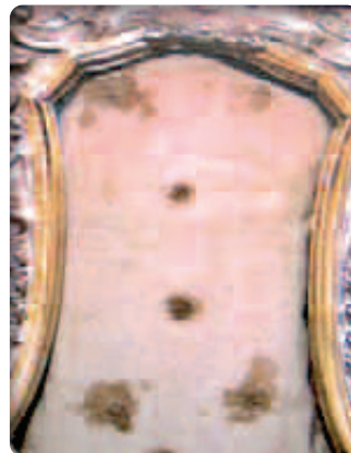
Thánh tích khăn thánh thấm máu