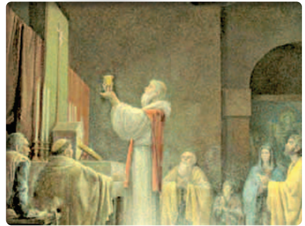
Tranh họa miêu tả phép lạ trong vương cung thánh đường