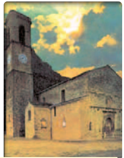
Wương cung thánh đường Santa Maria di Bagno di Romagna